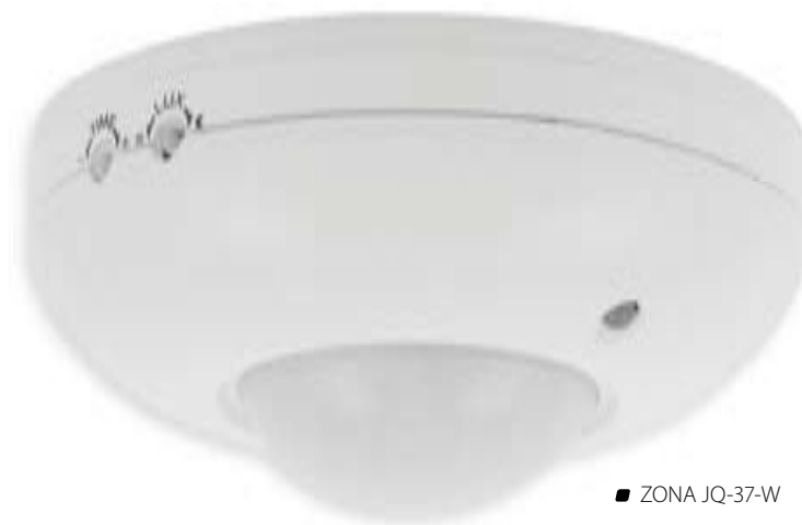
■ ZONA JQ-37-W